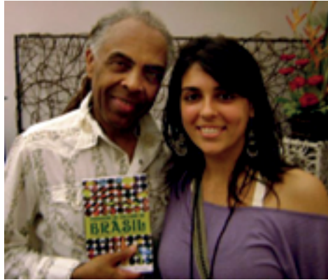
Figura 5 Entrega do meu primeiro livro para Gilberto Gil (2009)