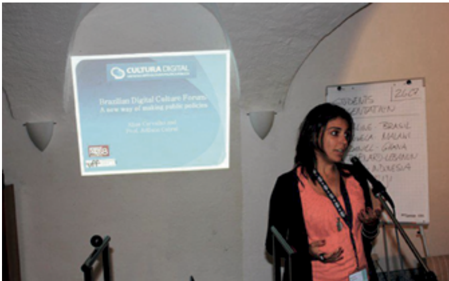
Figura 6 Comunicação na Escola de Verão Europeia de Governança da Internet (2011)